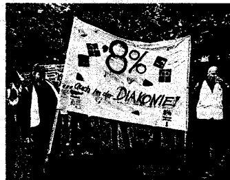
Diakonie-Mitarbeiter protestierten 2009 für höhere Löhne. Ihr Arbeitgeber klagte gegen die Aktion und bekam recht