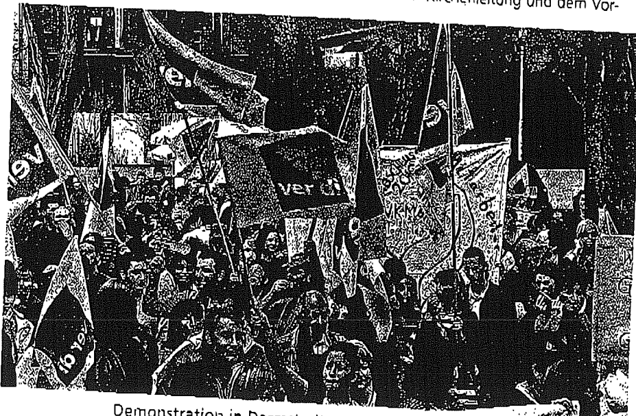
Demonstration in Darmstadt am 5. März 2010

Die Änderung des ARRG wurde letztlich nicht umgesetzt. Der VkM (Verband kirchlicher Mitarbeiter) kündigte Ende 2009 die mühsam erzielte Verabredung zur Bankabstimmung wieder auf. Die ver.di-Vertreter/innen wurden in wichtigen Fragen wie zum Beispiel bei der Tarifierhöhung 2010 überstimmt.